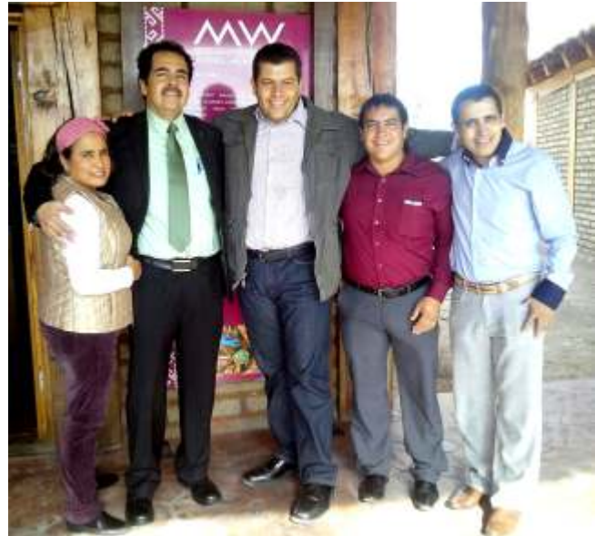
El Presidente Álvaro Madera López, con los Diputados Locales.