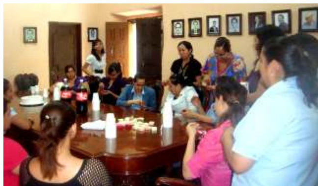
Convivencia del día de las madres en el ayuntamiento.

Con relación a la promoción de personal durante el primer semestre se llevó a cabo el cambio de puesto de 4 personas.