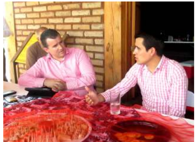
Reunión de trabajo con el Secretario del Gobernador del Estado de Jalisco.