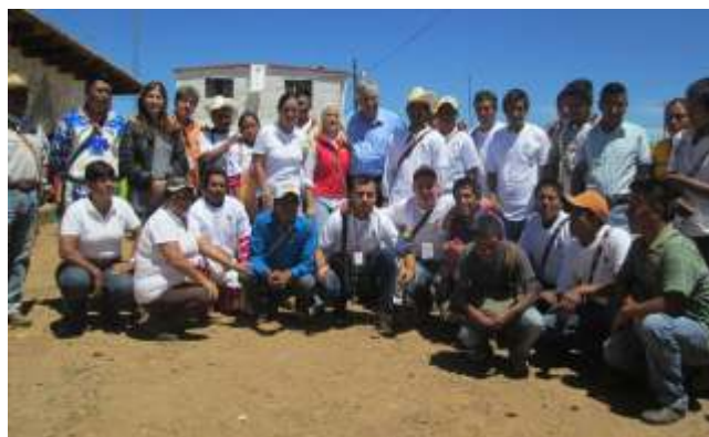
Afiliación al seguro de vida para madres solteras en San Andrés Cohamiata.