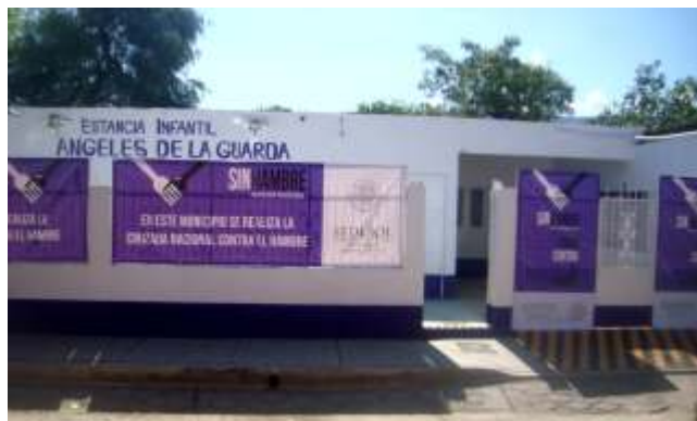
Estancia infantil “Angeles de la Guarda” en la cabecera municipal.

Y en materia educativa se realizaron las gestiones necesarias para conseguir que a partir del mes de septiembre la Misión Cultural pueda radicarse en nuestro municipio durante dos años, acción que beneficiara a todos los sectores de la sociedad.