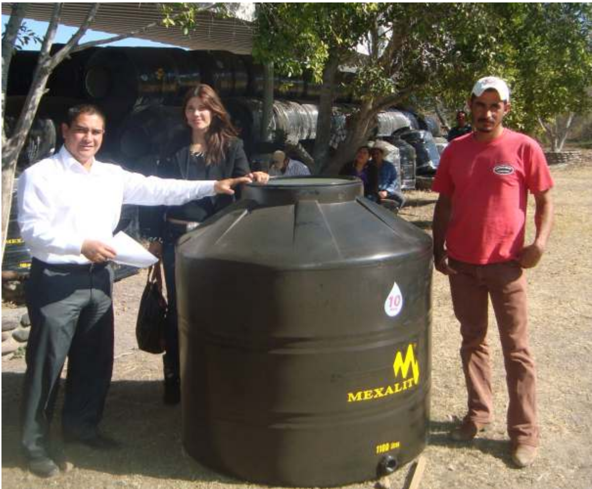
Etapa de entrega de tinacos.