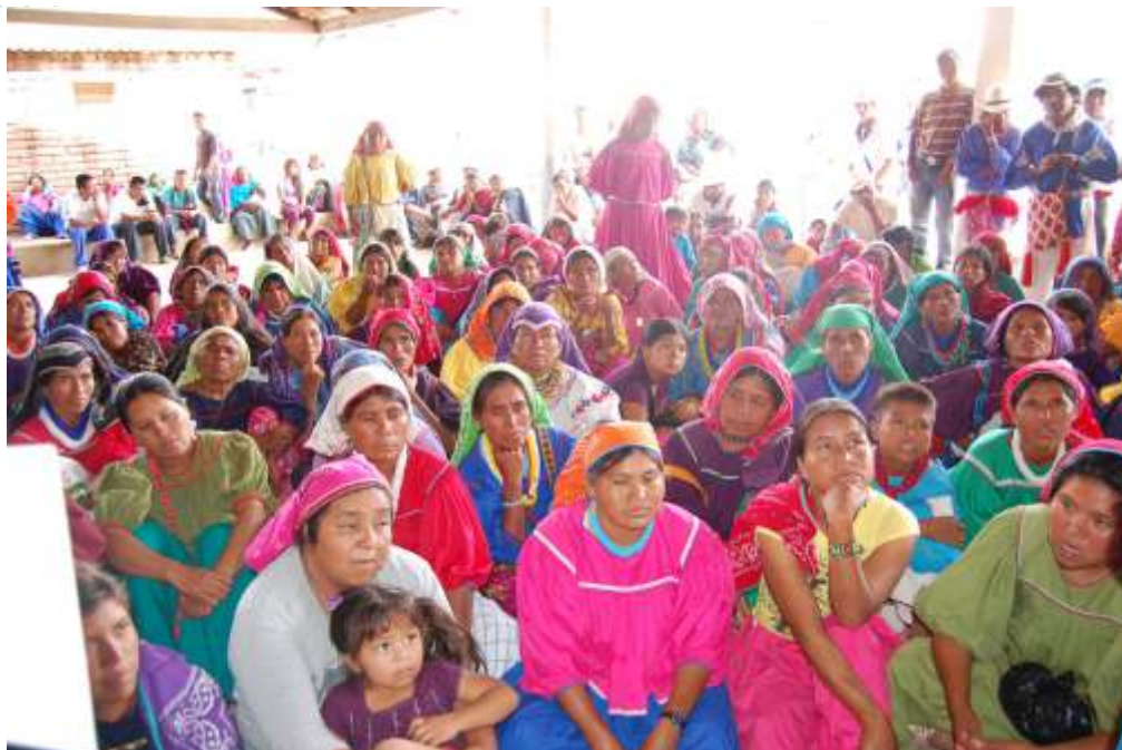
Mujeres de San Sebastián.