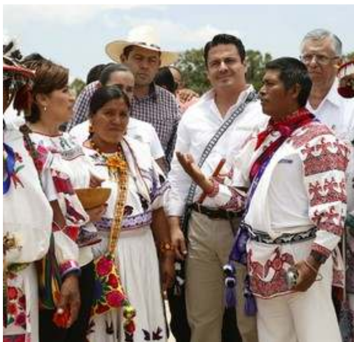
Visita a Pueblo Nuevo de Rosario Robles Berlanga y H. Gobernador Jorge Aristóteles Sandoval Díaz.