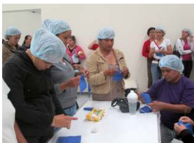
Trabajadores de la maquiladora COHMEDIC.