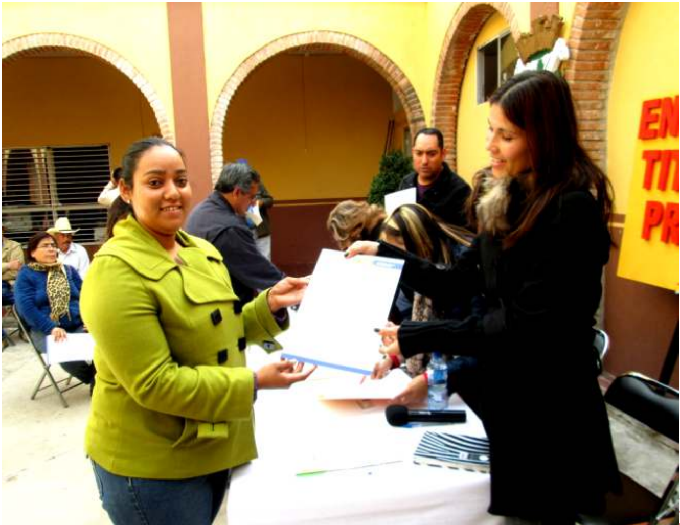
Entrega de títulos de propiedad.

Se incluyen en las labores de la dependencia, las comisiones de Hacienda, aspectos Constitucionales, inspección y vigilancia de Reglamentos y Comunicación Social; que con atingencia se atienden desde una perspectiva consciente, incluyente y humanista.