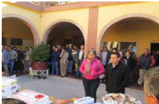
Convivencia de personas del ayuntamiento por el día de reyes.

Dentro de los instrumentos necesarios para la regulación de la relación laboral entre el H. Ayuntamiento y su personal se proyecta elaborar los siguientes manuales: Catálogo de Puestos, Manual del Clima Laboral, Manual de Mejora Continua, Manual de sistema de Evaluación, Diagnóstico de Capacitación, Calendario de Capacitación, Programa de Reconocimientos, Reglamento Interno.