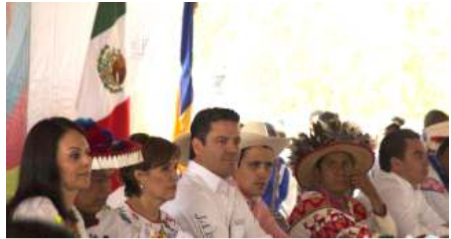
Firma de acuerdo con las autoridades federales, estatales y municipales, con los wixárikas en Pueblo Nuevo.

Además, de acudir a eventos tradicionales distintivos de la cultura wixárika, y celebraciones festivas de carácter general.