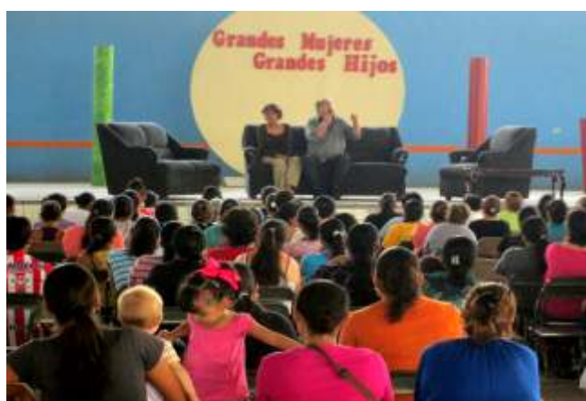
Conferencia de autoestima femenil: "Grandes Mujeres, Grandes Hijos".