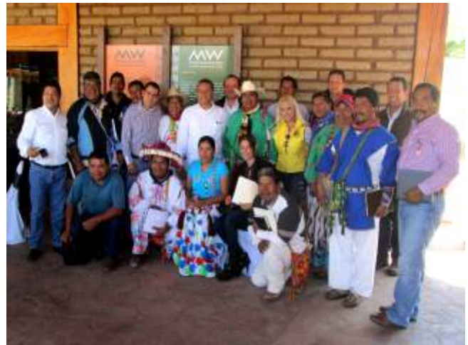
Reunión de trabajo con el Secretario de Gobernación del Estado de Jalisco.